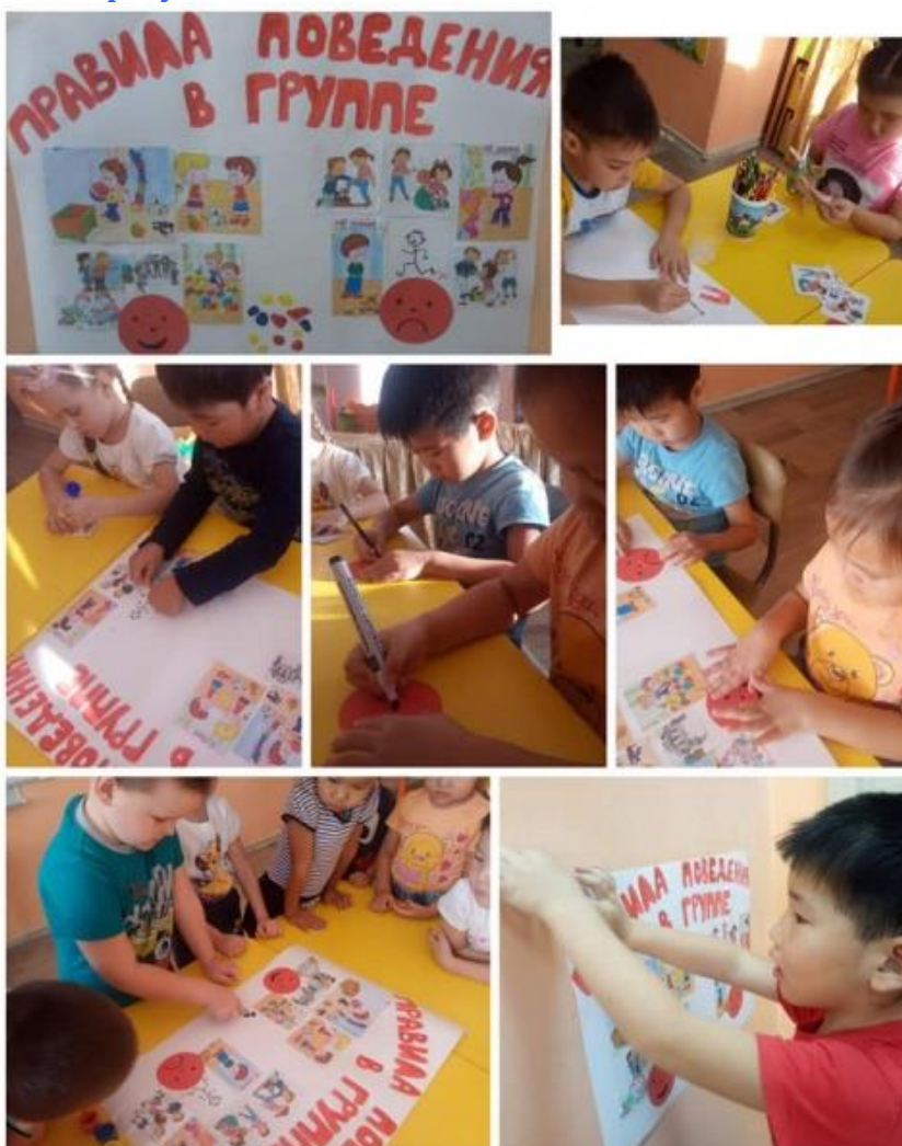
ПРАВИЛА, СОЗДАННЫЕ ДЕТЬМИ

Мы с детьми старшей группы реализовали проект «Говорящие стены: правила созданные детьми». Ребята, приняли участие в оформлении правил поведения в группе. Правила работают, если дети сами принимали участие в их создании. Давайте возможность дошкольнику проявлять выдумку и инициативу в играх и самостоятельной деятельности, будь то творческие или познавательные занятия, и тогда у него появится уверенность в себе, появится стремление ставить цели и добиваться результата.